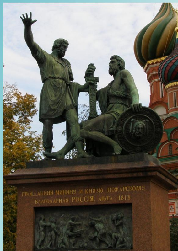
Памятник Минину и Пожарскому работы скульптора И. П. Мартоса (1752 - 1835) - один из самых известных памятников Москвы. Он создавался с 1804 по 1815 гг. на народные пожертвования и был установлен 20.02.1918 г. (по старому стилю) на Красной площади напротив входа в Верхние торговые ряды.

И поднималась Русь с колен В руках с иконой перед битвой, Благословленная молитвой Под звон грядущих перемен.